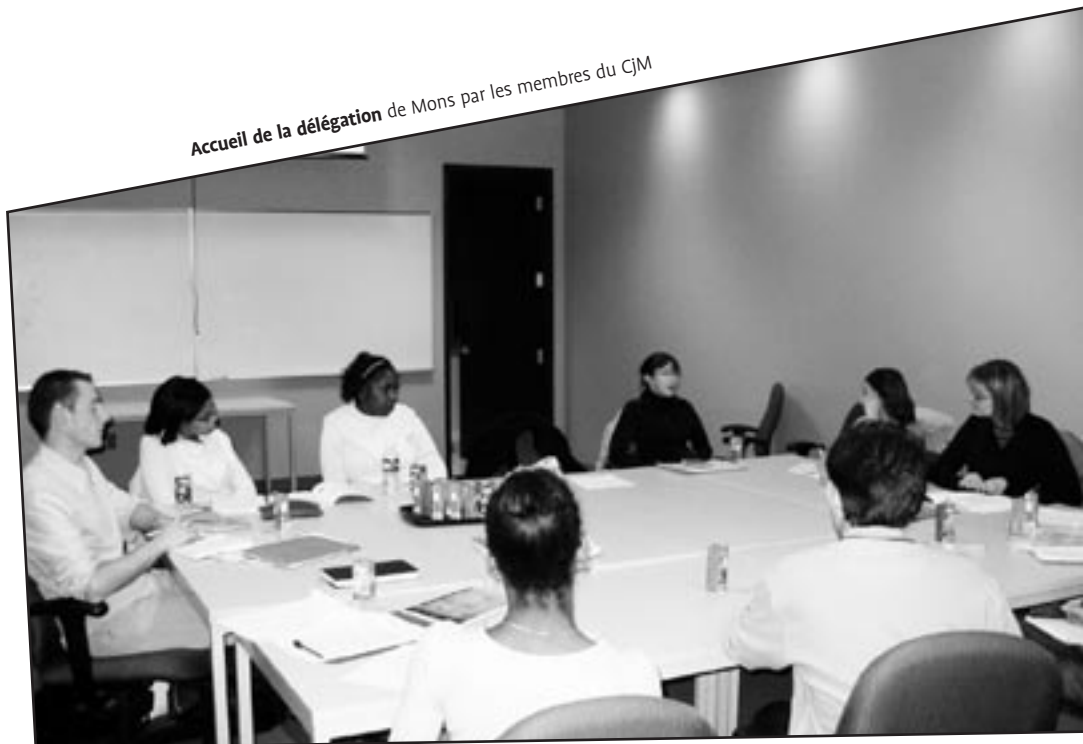
Accueil de la délégation de Mons par les membres du CJM